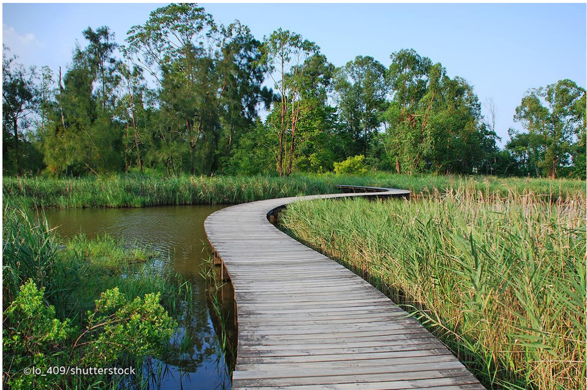
Водно-болотний парк у Гонконгу.