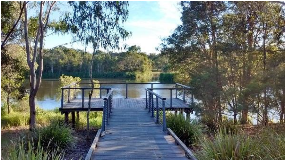
Конструкція на воді, Berrinba Wetlands, Брісбен, Австралія