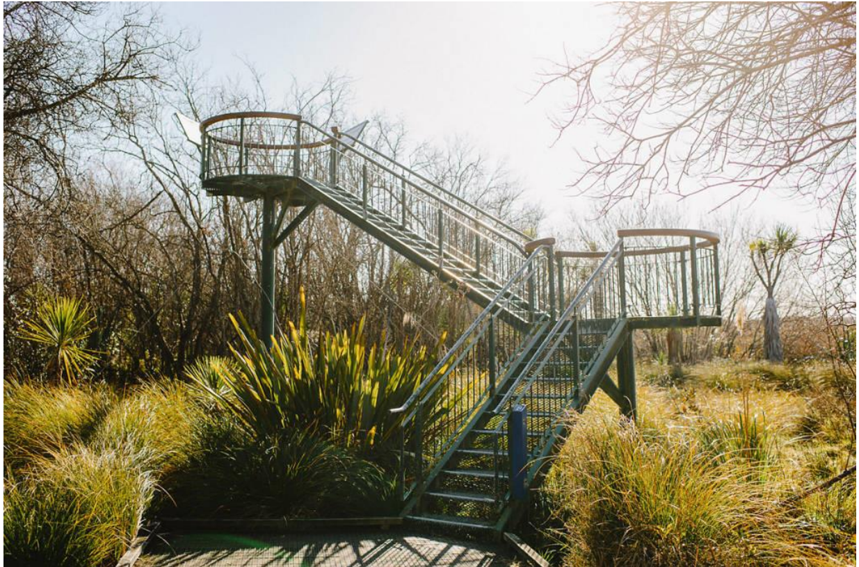
Вежа для милування краєвидами і спостереженням за птахами, Hagley Park, Christchurch, Нова Зеландія