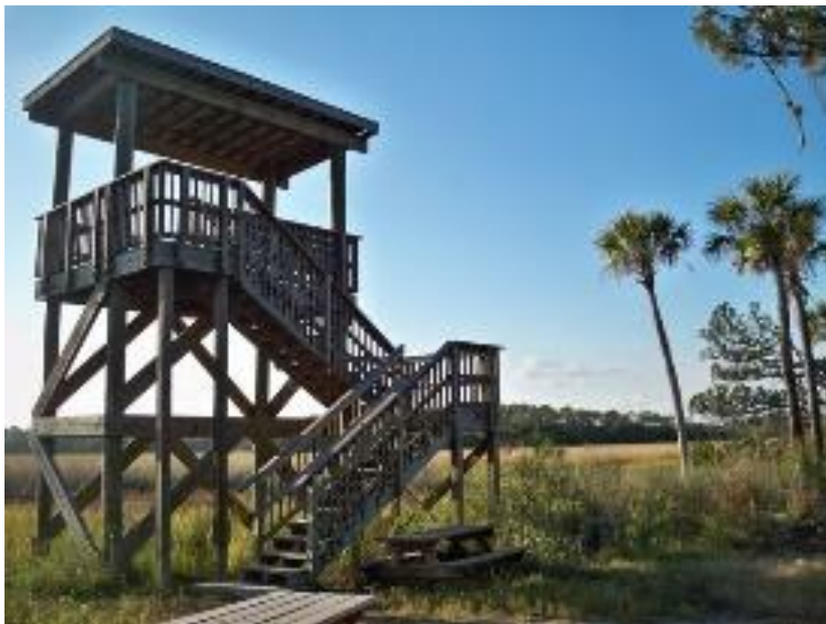
Вежа для милування краєвидами і спостереженням за птахами, Spruce Creek Park, Port Orange, США