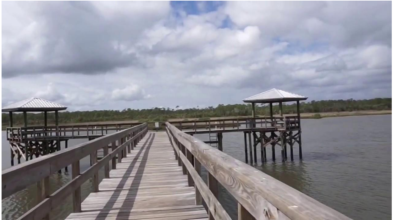
Конструкція на воді, Spruce Creek Park, Port Orange, США