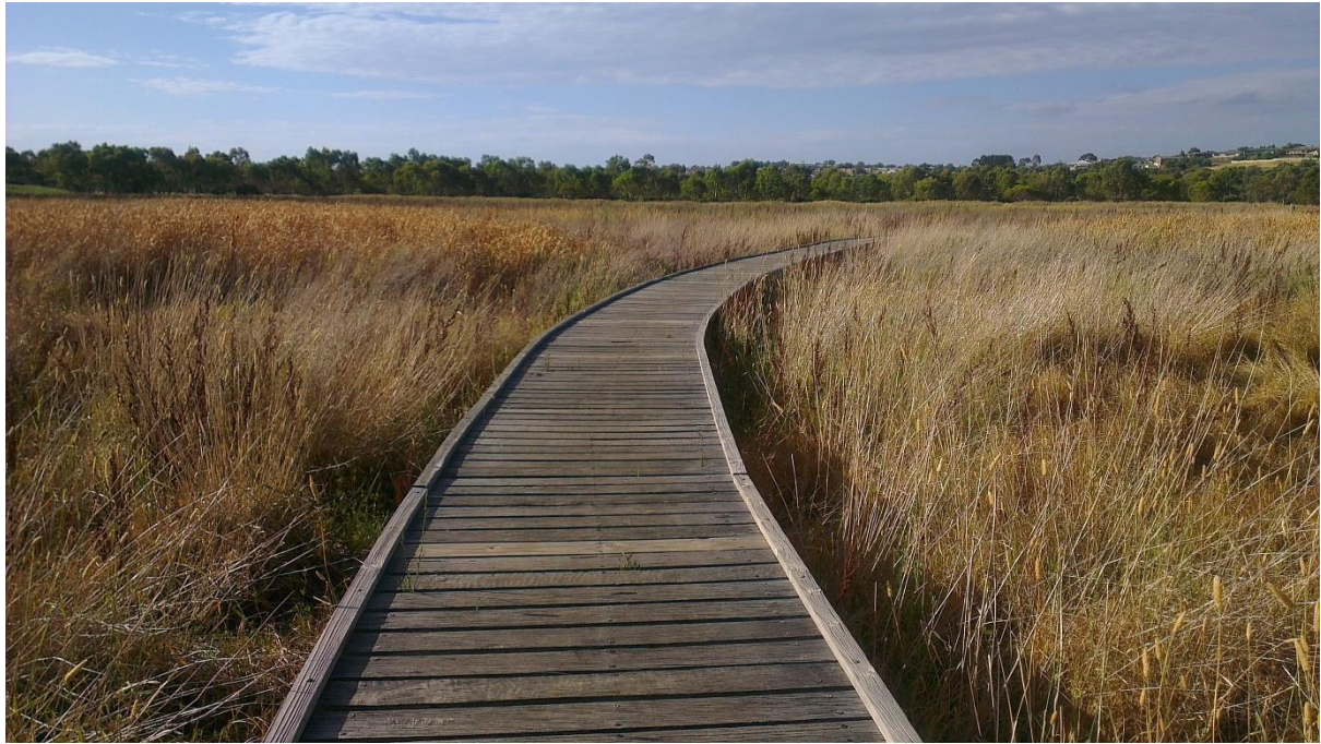
Реалізація доріжки на заболоченій місцевості в Onkararinga River Recreation Park (Аделаїда, Австралія)