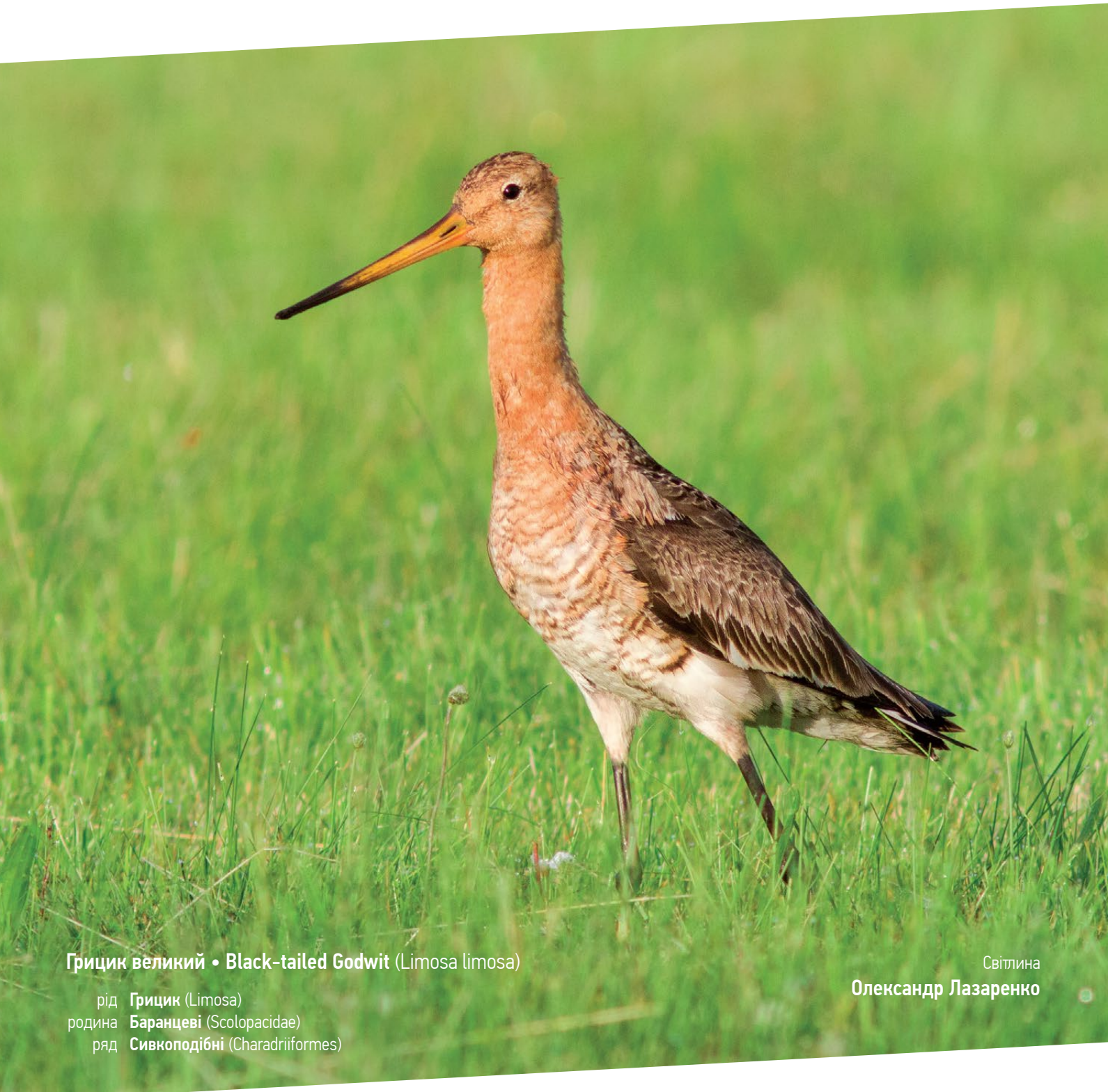
Грицик великий • Black-tailed Godwit ( Limosa limosa )