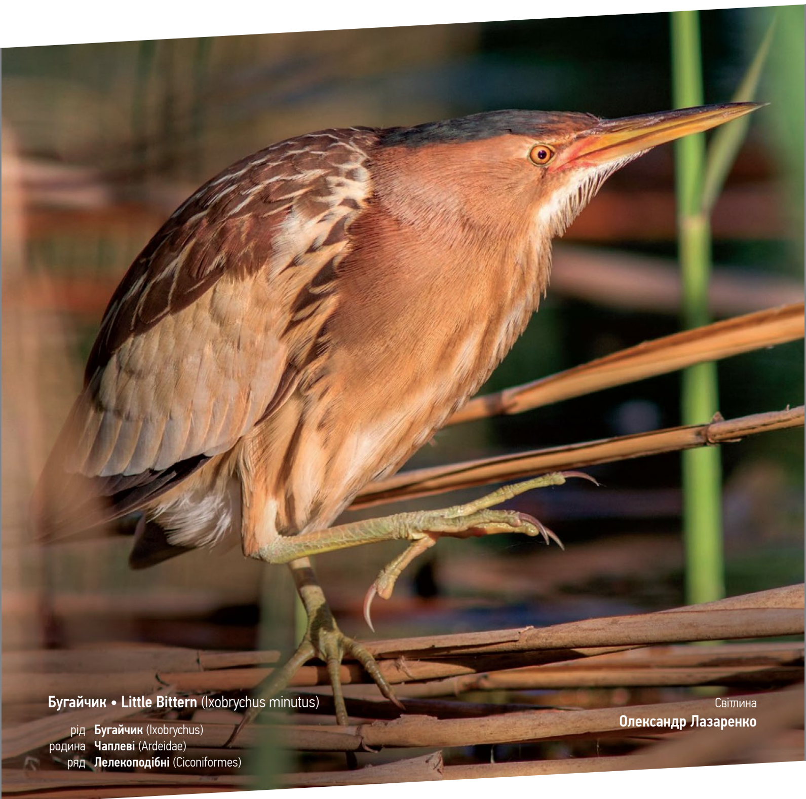
Бугайчик • Little Bittern ( Ixobrychus minutus )

рід Бугайчик ( Ixobrychus ) родина Чаплів ( Ardeidae ) ряд Лелекоподібні ( Ciconiformes )