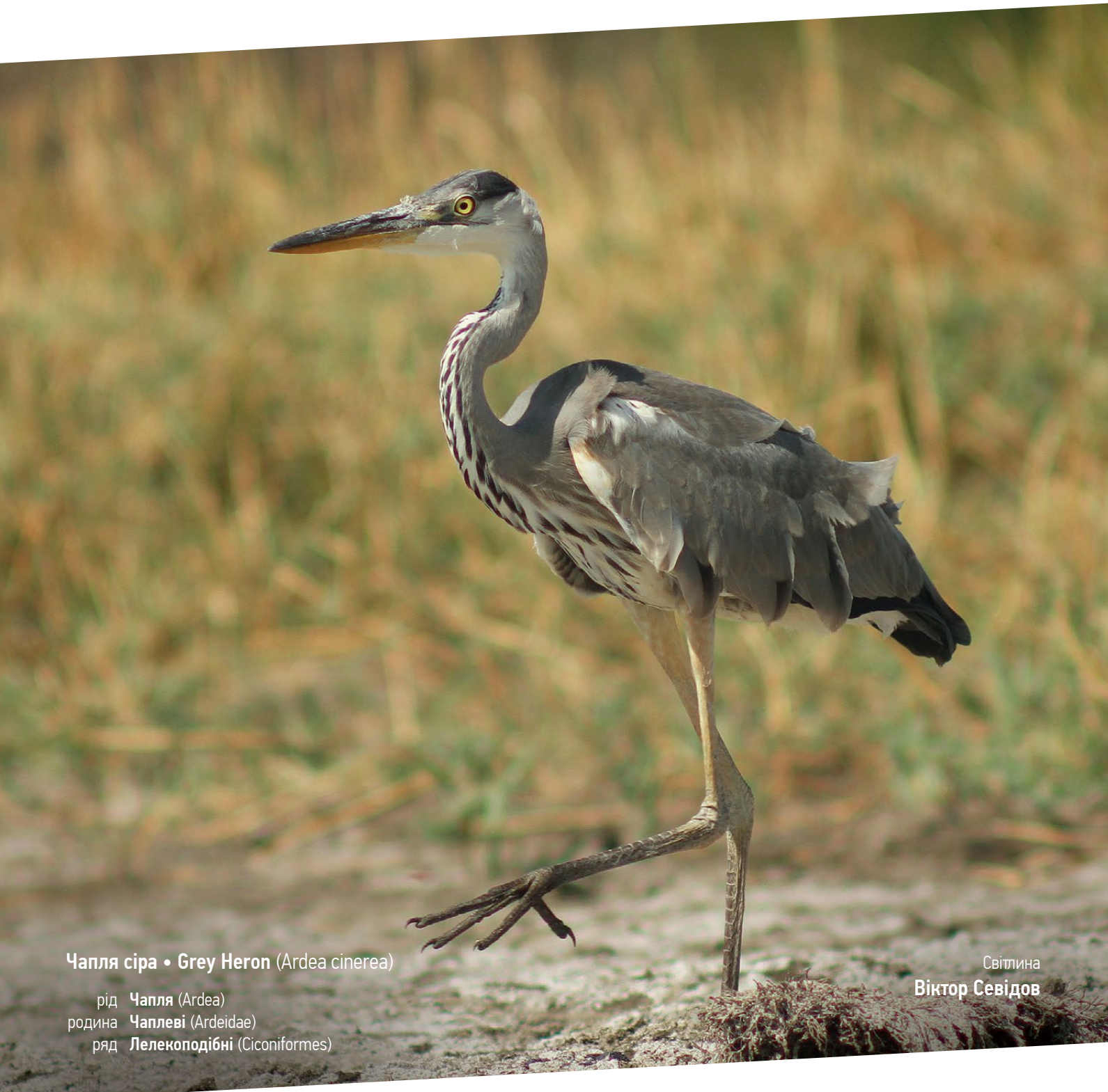
Чапля сіра • Grey Heron (Ardea cinerea)

рід Чапля (Ardea) родина Чаплеві (Ardeidae) ряд Лелекоподібні (Ciconiformes)