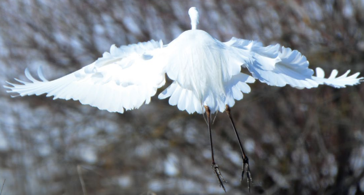
Чепура велика, велика біла чапля • Great Egret (Egretta alba)

ПТАХИ ЕКОПАРКУ BIRDS OF WETLANDPARK OSOKORKY