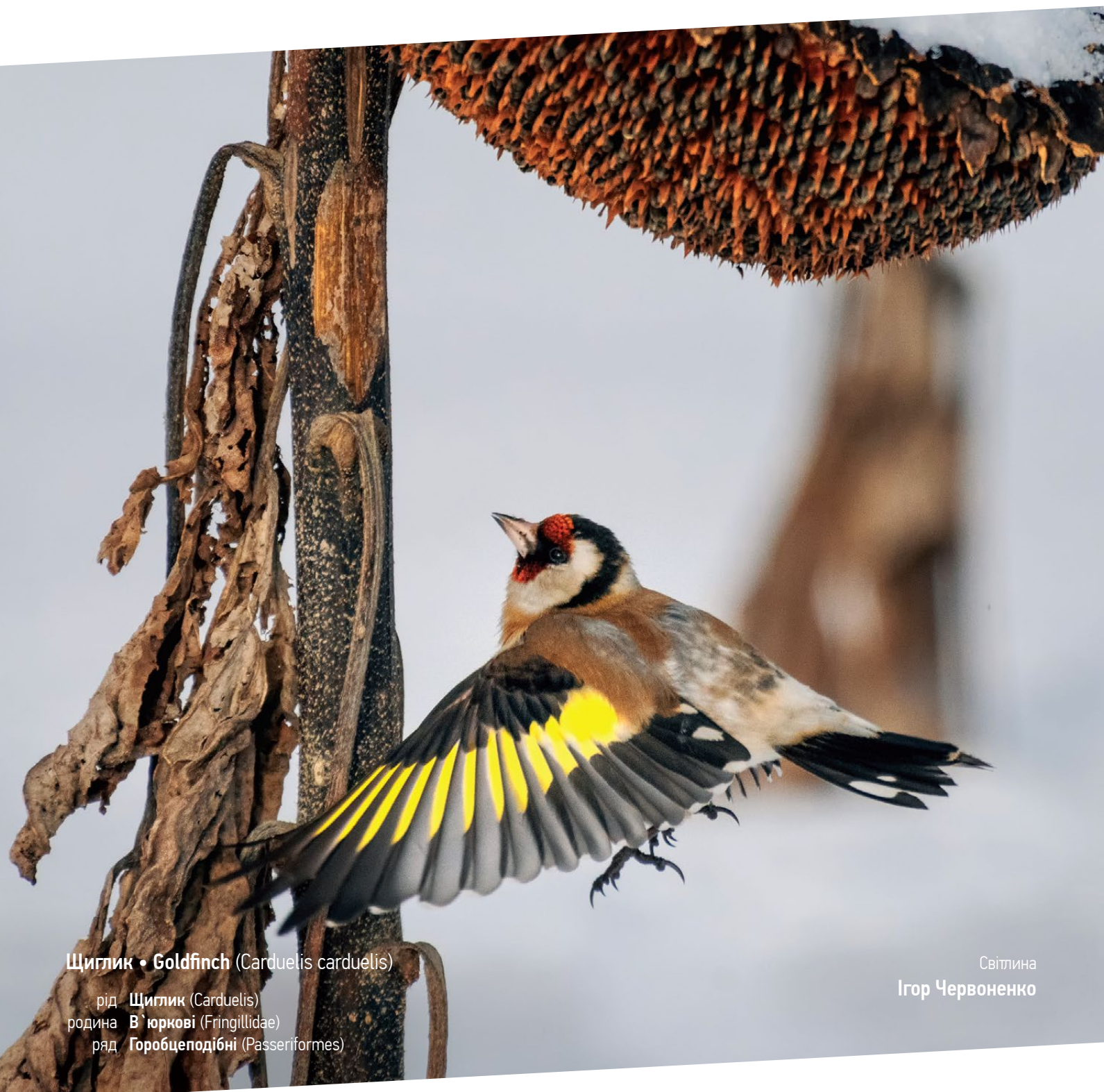
Щиглик • Goldfinch (Carduelis carduelis)

рід Щиглик (Carduelis) родина В`юркові (Fringillidae) ряд Горобцеподібні (Passeriformes)