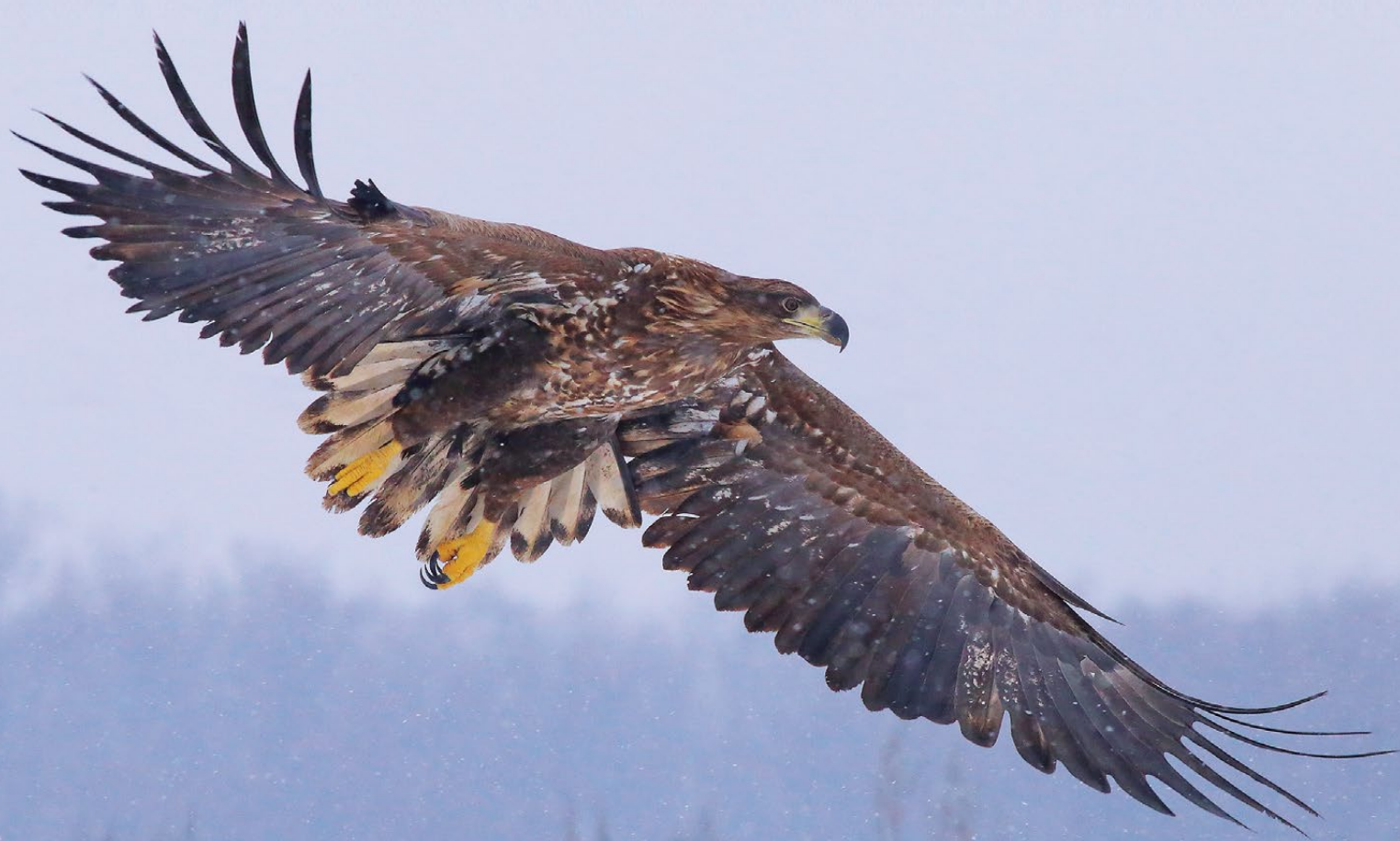
Орлан-білохвіст • White-tailed Eagle ( Haliaeetus albicilla )

рід Орлан ( Haliaeetus ) родина Яструбові ( Accipitridae ) ряд Соколоподібні ( Falconiformes )