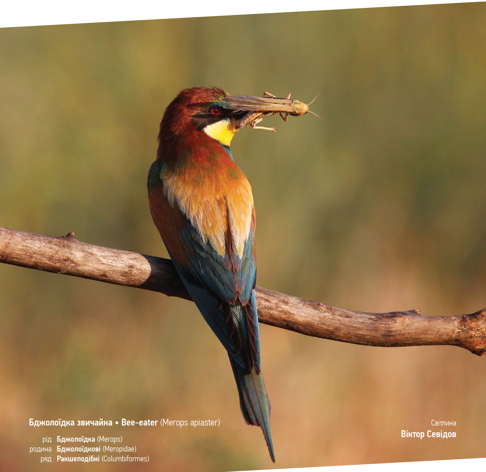
Бджолоїдка звичайна • Vee-eater (Merops apiaster)

рід Бджолоїдка (Merops) родина Бджолоїдкові (Meropidae) ряд Ракшеподібні (Columbiformes)