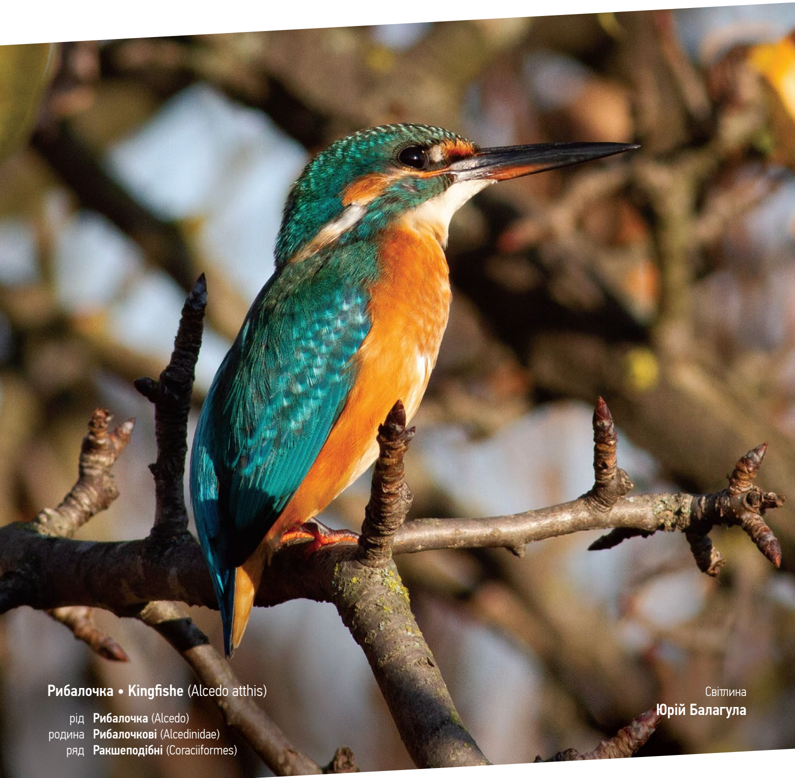
Рибалочка • Kingfisher (Alcedo atthis)

рід Рибалочка (Alcedo) родина Рибалочкові (Alcedinidae) ряд Ракшеподібні (Coraciiformes)