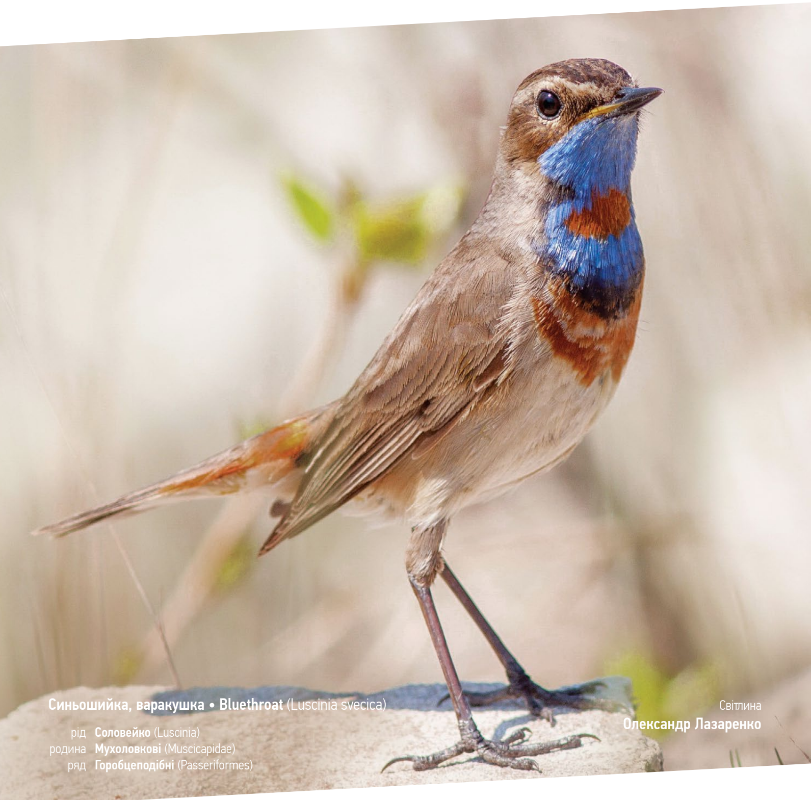
Синьошийка, варакушка • Bluethroat (Luscinia svecica)