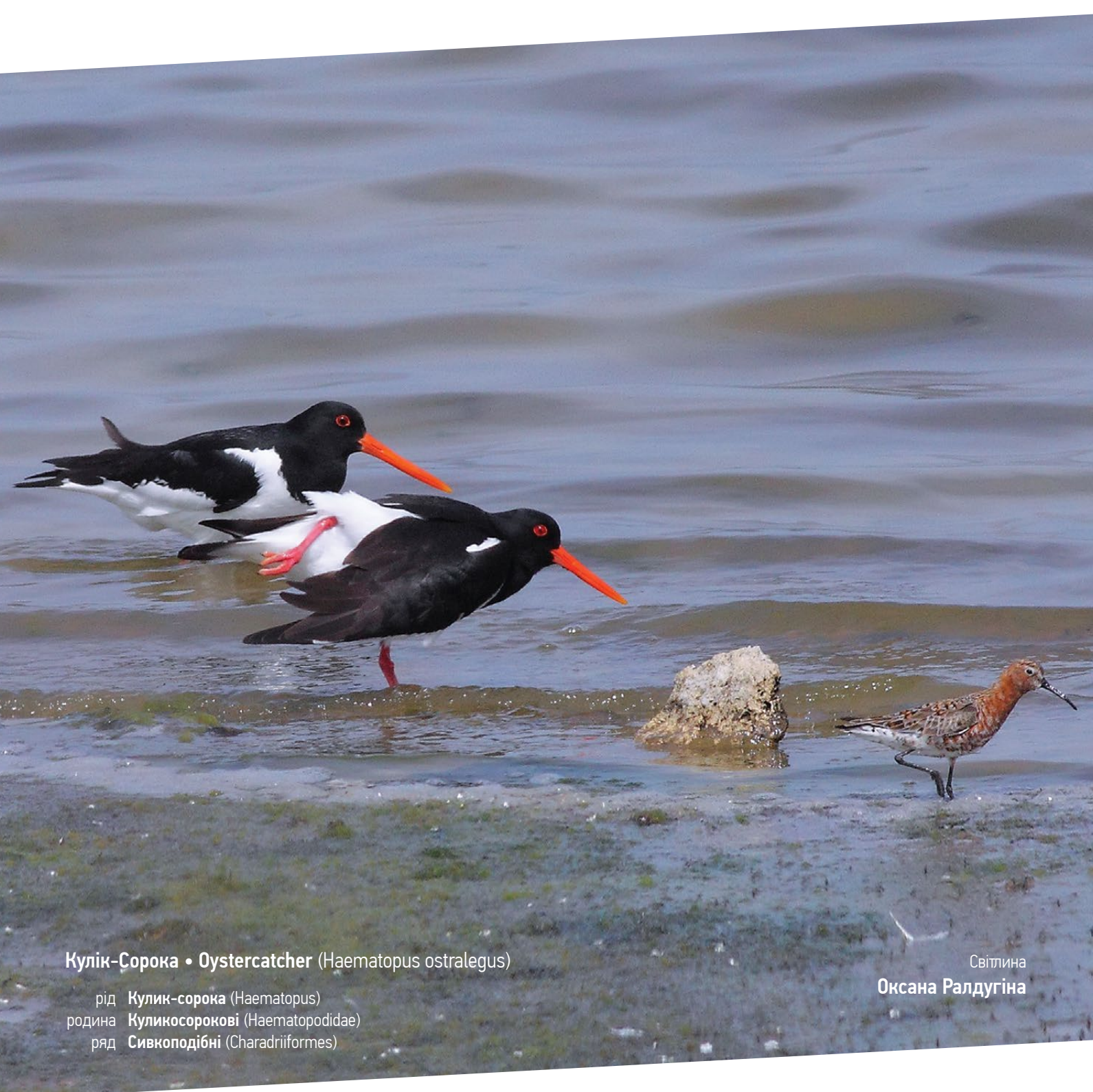
Кулик-Сорока • Oystercatcher (Haematopus ostralegus)

ПТАХИ ЕКОПАРКУ BIRDS OF WETLANDPARK OSOKORKY